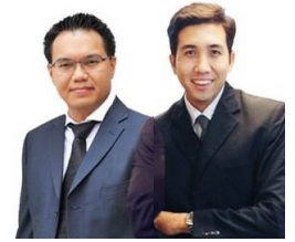
อดิศักดิ์ ผู้พัฒนทรัพย์กุล วิษณุ ธรรมบำรุง

รายงานฉบับนี้จัดทำโดยบริษัทหลักทรัพย์ธนชาต จำกัด (มหาชน) โดยจัดทำขึ้นบนพื้นฐานของแหล่งข้อมูลที่เชื่อถือได้มากที่สุดที่ได้รับมาและพิจารณาแล้วว่าน่าเชื่อถือ ทั้งนี้มีวัตถุประสงค์ เพื่อให้บริการเผยแพร่ข้อมูลแก่ผู้ลงทุนและใช้เป็นข้อมูลประกอบการตัดสินใจซื้อขายหลักทรัพย์ แต่ไม่ได้มีเจตนาชี้แนะหรือเชิญชวนให้ซื้อหรือขายหรือประกันราคาหลักทรัพย์แต่อย่างใด ทั้งนี้รายงานและความเห็นในเอกสารฉบับนี้อาจมีการเปลี่ยนแปลงแก้ไขได้ หากข้อมูลที่ได้รับมาเปลี่ยนแปลงไป การนำข้อมูลที่ปรากฏอยู่ในเอกสารฉบับนี้ ไปว่าทั้งหมดหรือบางส่วนไปทำซ้ำ ดัดแปลง แก้ไข หรือนำออกเผยแพร่แก่สาธารณชน จะต้องได้รับความยินยอมจากบริษัทก่อน